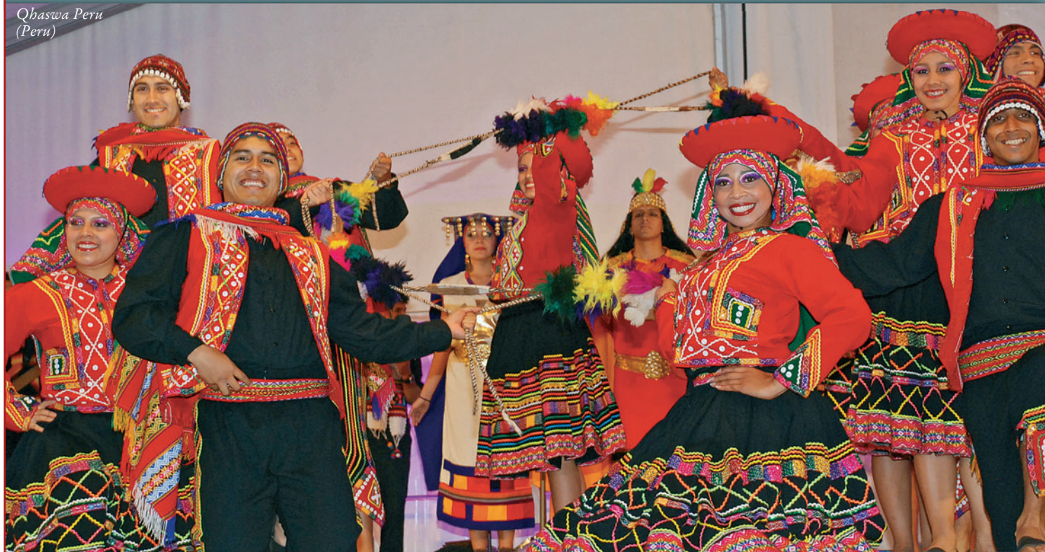
Qhaswa Peru (Peru)

et récemment sur le tourisme. L'Ensemble folklorique Qhaswa Peru a porté en scène la grande diversité culturelle du troisième plus grand pays d'Amérique du Sud. Là trois évidents secteurs géographiques déterminent la vie quotidienne et la culture: la côte, les Andes, la forêt amazonienne. Au-delà des rives de l'Océan Pacifique, un territoire quasiment tout désertique inclut la vaste aire urbaine de Lima et ses quelques 10 millions d'habitants, un tiers de la population péruvienne. La venue en différentes époques de migrants d'Europe, d'Asie et, notamment, d'Afrique en a largement influencé les arts et la musique. Vers l'Est le désert laisse soudainement place aux pics et aux vallées des Andes, où les habitants sont majoritairement des indigènes d'origine Inca. Là le lien culturel avec les forces de la terre et les souvenirs d'un passé tragique de persécution est très fort. Au-delà de la Cordillère, voilà la plaine