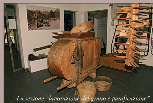
La sezione "lavorazione del grano e panificazione".

Ogni museo etnografico costituisce un vero e proprio patrimonio culturale coraggiosamente sottratto all'oblio e messo a disposizione di ricercatori e appassionati visitatori. Va detto che se tanto sacrificio è costato creare questi musei, altrettanto impegnativo è oggi mantenerli aperti al pubblico. Perciò a Donnas la Giornata è stata aperta da una conferenza sul tema "Musei Etnografici tra valorizzazione del patrimonio e problemi di gestione", ai cui lavori ha voluto portare il suo saluto l'assessore regionale all'Istruzione e Cultura Laurent Viérin.