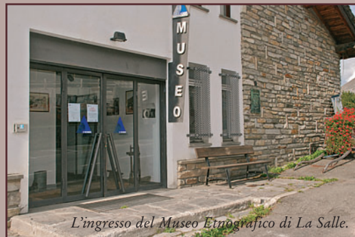
L'ingresso del Museo Etnografico di La Salle.

L a Salle ha partecipato con altri 18 Comuni valdostani alla Giornata dei Musei etnografici organizzata l'11 settembre scorso dalla Commissione per le attività della Biblioteca comprensoriale di Donnas. Per l'occasione alcuni degli strumenti esposti al Museo Etnografico di La Salle, e in particolare diversi oggetti e tante immagini che arricchiscono la sezione dedicata alla lavorazione del grano e alla panificazione, sono stati trasportati a Donnas, dove sono entrati a far parte di una mega-esposizione organizzata col preciso intento di far conoscere le tante piccole realtà museali della Valle d'Aosta: tanti preziosi mini-musei nati dalla passione e dall'impegno di tantissimi cultori di storia locale. Per esempio, a La Salle, per l'allestimento del Museo c'è stata la partecipazione corale di tante persone, basti pensare che per la sola sezione della panificazione, oltre agli