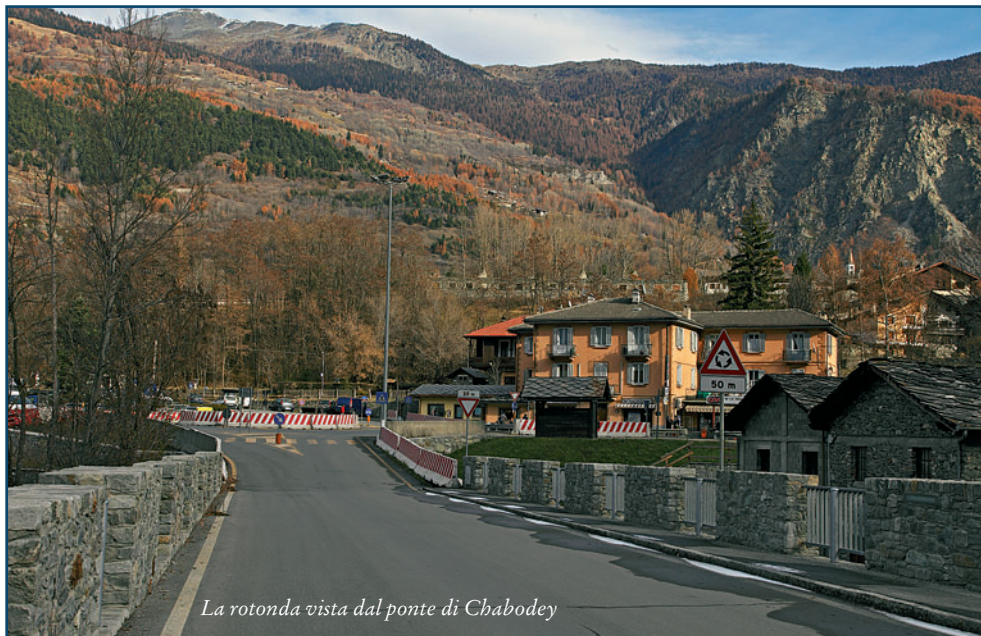
La rotonda vista dal ponte di Chabodey

Con quest'atto finale la Regione ha dato ufficialmente la via libera all'affidamento dei lavori, grazie ai quali verranno messe finalmente in opera le buone idee maturate in tutti questi anni.