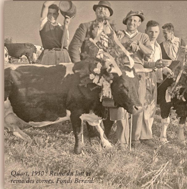
Quart, 1950 : Reine du lait et reine des cornes.

Le Journal de La Salle iscritto nel registro stampa del Tribunale di Aosta con decreto n.5 dell'1 giugno 1999.