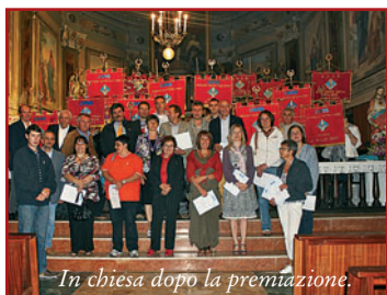
In chiesa dopo la premiazione.