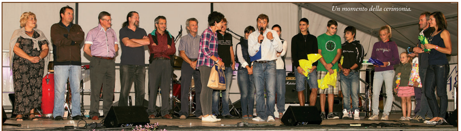
Un momento della cerimonia.