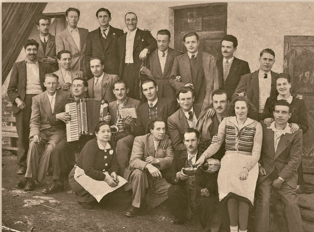
I coscritti di La Salle, classe 1916, si ritrovano trentenni nel 1946 e posano per una foto ricordo davanti al Bar della centrale piazza di La Salle (dove oggi c'è la Tavernetta).

La comunità più numerosa è quella marocchina, con 72 persone, seguita da quella rumena (46) e da quella albanese (23). Si tratta di una popolazione in continuo aumento, cresciuta del 23,87% negli ultimi tre anni e mezzo: al 31 dicembre 2007 gli stranieri residenti erano infatti 155. È una popolazione giovane: 42 hanno meno di 18 anni (22%), 89 hanno tra 18 e