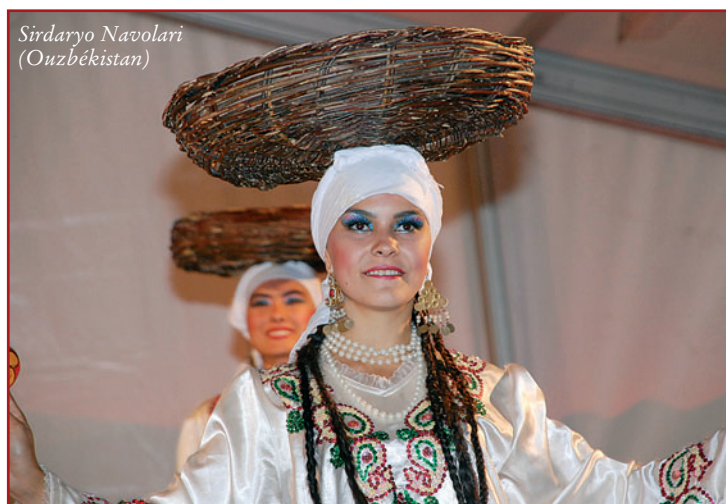
Sirdaryo Navolari (Ouzbékistan)

Aujourd'hui cet Etat, indépendant dès 1991, soutient son économie sur l'agriculture (culture du coton, du riz, de la vigne), sur l'élevage, sur ses grandes richesses minières (gaz naturel, cuivre, uranium, pétrole)