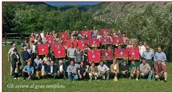
Gli avvisini al gran completo.