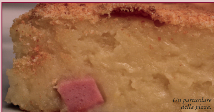
Un particolare della pizza.

si di questi pochi semplici ingredienti e procedere come segue.