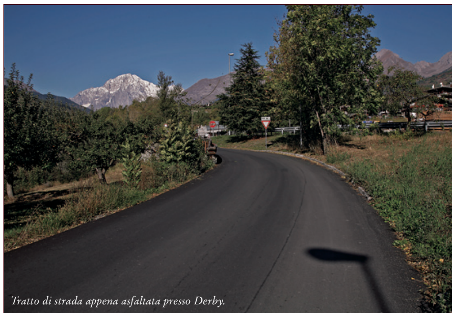
Tratto di strada appena asfaltata presso Derby.