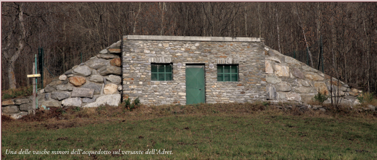
Una delle vasche minori dell'acquedotto sul versante dell'Adret.

G razie ad un finanziamento FoSPI, integrato da fondi comunali, sono iniziati nel settembre 2004 e sono stati ultimati nel 2007 i lavori di ammodernamento e potenziamento dell'acquedotto principale di La Salle, collegato alla vasca-serbatoio di accumulo di Morge, alimentata dalle sorgenti Planaval ed Éculés. Esecutrice dei lavori è stata l'impresa CPL Polistena del Consorzio ravennate delle cooperative di produzione e lavoro. La spesa complessiva è stata di 1.977.932,95 euro. Il Comune si è fatto carico direttamente della spesa di 62.772,00 euro con la quale l'impresa SOGEA ha prov-