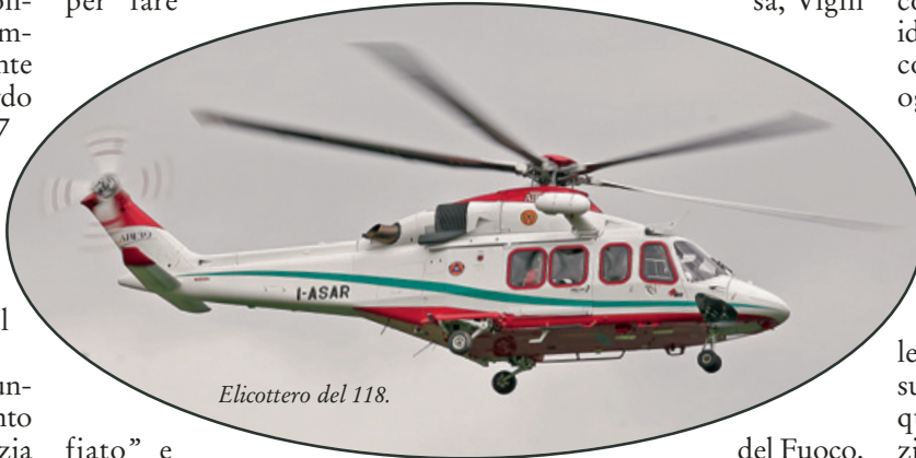
Elicottero del 118.

Anche un soccorso in condizioni normali può presentare difficoltà che costringono la squadra a operare ai limiti della resistenza fisica. Come quando, per esempio, occorre effettuare il recupero nella profondità di un crepaccio, in cui il corpo, spesso senza vita, di un alpinista è incastrato in uno spazio largo quanto uno scarponne. Allora occorre montare un'attrezzatura specifica per potersi calare e iniziare a scavare nel ghiaccio, con l'aiuto di un compressore,