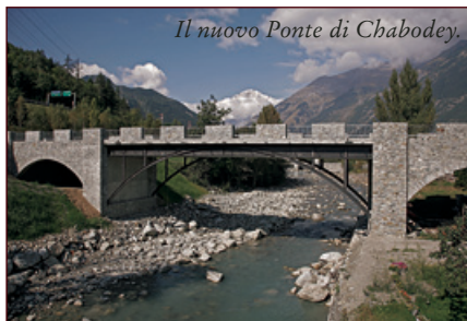
Il nuovo Ponte di Chabodey.

Il 14 giugno 2004 è la data di approvazione da Parte della Regione del progetto preliminare presentato dalla Comunità Montana per la costruzione del nuovo ponte di Chabodey e per la realizzazione in destra orografica di un tratto di viabilità alternativa tra La Salle e Morgex. Un progetto seguito passo per passo dall'Amministrazione Comunale di La Salle. Il collaudo tecnico del ponte è avvenuto il 20 novembre 2008 e la sua inaugurazione per la definitiva apertura alla libera circolazione, anche con i mezzi pesanti, si è svolta il 15 dicembre 2008 alla presenza del Presidente del Consiglio Regionale Alberto Cerise. L'arrivo del nuovo ponte ha messo fine una volta per tutte ad un notevole disagio: il Comune infatti ha dovuto creare di sana pianta una via di emergenza per consentire ai mezzi pesanti di attraversare la Dora, perché il vecchio ponte, ormai lesionato e riparato nel 2000, non poteva sopportare più la circolazione di mezzi con portata superiore alle 15 tonnellate. Perciò l'Amministrazione ha deciso di acquistare, per una spesa di 14.000,00 euro, un ponte di ferro chiamato "Bailey doppio doppio" che la Società Autostrade stava