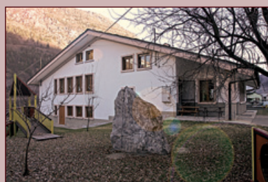
La Scuola dell'Infanzia a Derby.