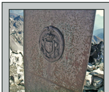
Sulla cima della Grande Rochère.