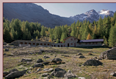
Il nuovo complesso costruttivo di Promou. Sotto: l'edificio visto dall'Alta Via n. 2.