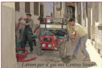
Lavori per il gas nel Centro Storico.

Nel 2003 è arrivato a La Salle il Gas GPL grazie all'autorizzazione che il Comune ha accordato alla compagnia Alpigas di Aosta di interrare nel capoluogo due bomboloni deposito da cui si diramano le condutture per il rifornimento agli abitanti. Alpigas naturalmente paga un regolare affitto per usufruire dello spazio in cui è stato localizzato il deposito.