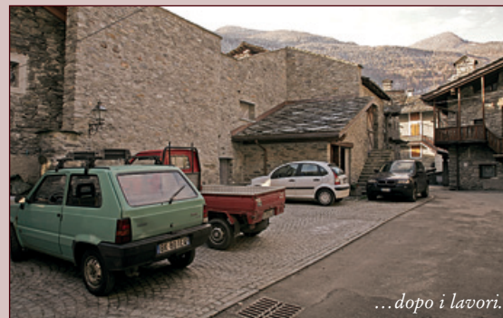
...dopo i lavori.

Nella primavera-estate del 2004, al centro del villaggio Villaret, dopo la demolizione di un vecchio fabbricato pericolante, il Comune ha potuto valorizzare un'area di circa 140 metri quadrati creandovi un parcheggio con la relativa illuminazione e sistemandovi uno chalet per i contenitori della raccolta differenziata. Tutta la strada di accesso al villaggio fino alla nuova piazzetta è stata opportunamente allargata. I lavori, realizzati dall'impresa Matteo Carere, sono costati 125.126,98 euro, senza contare i 98.220,00 euro utilizzati per l'acquisto del fabbricato da demolire.