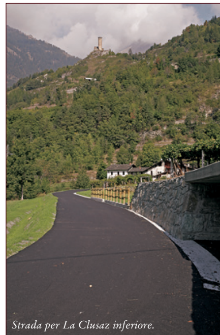
Strada per La Clusaz inferiore.

Anche il ritmo dei lavori di manutenzione e asfaltatura della interminabile rete viaria comunale è stato intensissimo: nel solo anno 2008, per esempio, sono stati spesi oltre 250 mila euro in asfaltature.