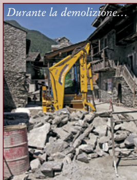
Durante la demolizione...