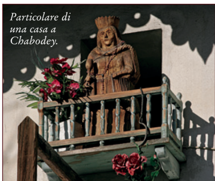
Particolare di una casa a Chabodey.

Nell'ambito dei lavori di emergenza ambientale (L. R. 5/2001) è stata programmata dal Comune nel 2003 la messa in sicurezza della parete rocciosa lungo la strada interna del villaggio di Chabodey. Il rimodellamento della scarpata e la posa di speciali reti di protezione sono stati i due principali interventi, completati nel 2005 dall'impresa specializzata Tekne per una spesa complessiva di 132.750,00 euro.