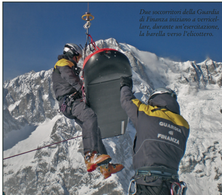
Due soccorritori della Guardia di Finanza iniziano a verricellare, durante un'esercitazione, la barella verso l'elicottero.

del Fuoco. Fra i componenti di una squadra di soccorso esiste un'intesa quasi simbiotica, ma allo stesso tempo è essenziale che ciascun soccorritore abbia la capacità individuale di svolgere il proprio compito specifico con la massima concentrazione e in modo perfetto. Una manovra tecnica sbagliata di un solo componente della squadra può compromettere un'intera operazione. Inoltre, sebbene ognu-