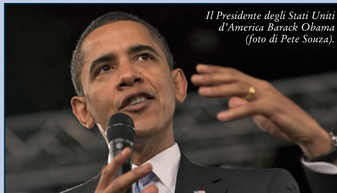
Il Presidente degli Stati Uniti d'America Barack Obama.

“All'alba del XXI secolo, in un mondo in cui davvero sapere è potere e la capacità di letto-scrittura rappresenta l'abilità che spalanca le porte di opportunità e successo, tutti noi, in qualità di genitori e bibliotecari, di educatori e cittadini,