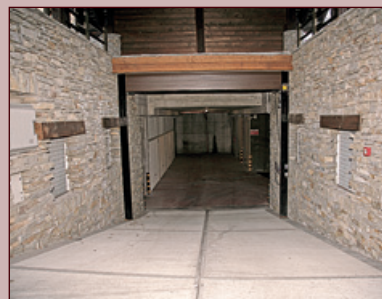
Sopra: la rampa di ingresso e l'ampio accesso ai garages. Sotto: scorcio dell'interno.