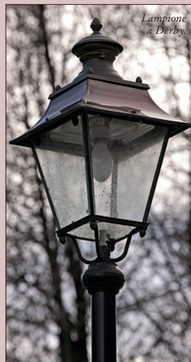
Lampione a Derby.

A partire dal 2006 anche la rete d'illuminazione pubblica è stata potenziata nelle seguenti località: nella frazione Moras, a Prarion, nel tratto Pià de Veulla-Plan di Tzaneno, nel parco Gerbollier, all'ingresso dei villaggi di Derby e Villaret, a Morge e a Planaval. La spesa ha superato i 140 mila euro.