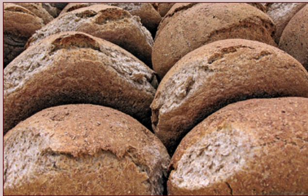
Prima e dopo un'informata di pane nero valdostano.

Fra il 2006 e il 2007 il Comune si è preoccupato di far ristrutturare il Mulino del Moyes e il Forno di Chez-Les-Monnet restituendo alla comunità di La Salle e ai turisti 2 veri e propri monumenti rurali. I lavori sono stati eseguiti entrambi dall'impresa Dino Lazier & C. di Gaby. Il Mulino è costato 84.315,41 euro ed è stato sistemato anche il canale attiguo al fabbricato al fine di ripristinare il collegamento idraulico con il sistema di funzionamento del mulino stesso. Il Forno è costato invece 75.316,16 euro comprensivi della sistemazione del vicino fontanile.