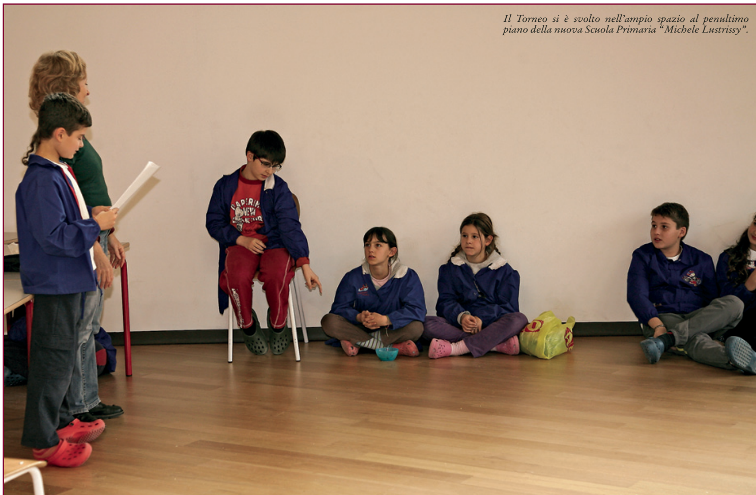
Il Torneo si è svolto nell'ampio spazio al penultimo piano della nuova Scuola Primaria "Michele Lustrissy".