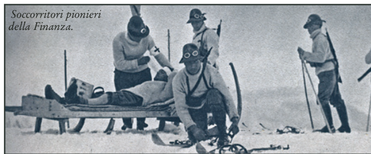
Soccorritori pionieri della Finanza.