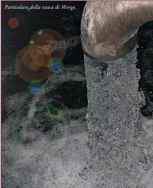
Particolare della vasca di Morge.

veduto al recupero e al consolidamento della vasca serbatoio di Morge che serve l'intero capoluogo di La Salle e tutte le frazioni circostanti. Sono stati ultimati nel 2006 anche i lavori per la captazione presso le sorgenti La Villottaz e Mont Falcon. La condotta principale e l'intera rete di distribuzione dell'acquedotto alimentato da queste due sorgenti sono state rimodernate per servire meglio gli abitati di Derby, Epinel, Le Champ, Chez-les-Gontier, Villaret, Cré, Villair, Chez-les-Rosset, Chez Beneyton e Moras. L'appalto, curato dall'Assessorato Territorio, Ambiente e Lavori Pubblici, è andato all'impresa Jacquemod Costruzioni che ha realizzato tutti i lavori per una spesa complessiva di 870.147,19 euro. A Derby, con l'occasione, il Comune ha fatto sistemare anche una serie di bocche antincendio che attingono direttamente dalla condotta principale per garantire una forte pressione in caso di necessità. Durante i lavori dell'acquedotto collegato alle sorgenti La Villottaz e Mont Falcon è stato necessario anche mettere in sicurezza l'area di Bois de Montondier, interessata da una frana: l'intervento, eseguito da una impresa specializzata, è costato 120.147,19 euro.