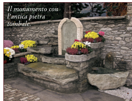
Il monumento con l'antica pietra tombale.

Nel 2004 l'arch. Dino Musa ha progettato su incarico del Comune un monumento funebre in cui collocare le spoglie e l'antica pietra tombale di Cassien Joseph Gerbollier. Il monumento, che ha trovato posto proprio all'ingresso del cimitero di