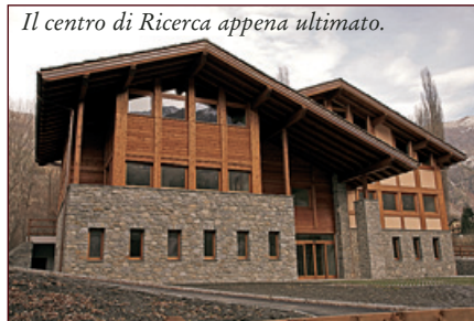
Il centro di Ricerca appena ultimato.

Sono stati inaugurati nel settembre 2009 i primi lavori di valorizzazione della Riserva Naturale del Marais, costati 650 mila euro. Inoltre 3.750.000,00 euro sono serviti per costruire e arredare la sede del Centro Regionale di Ricerca sulla Biologia Alpina , per il cui decollo scientifico-culturale la Regione Valle d'Aosta ha assicurato il massimo impegno.