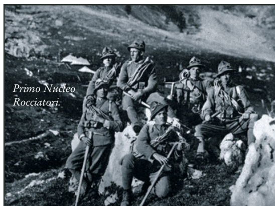
Primo Nucleo Rocciatori.